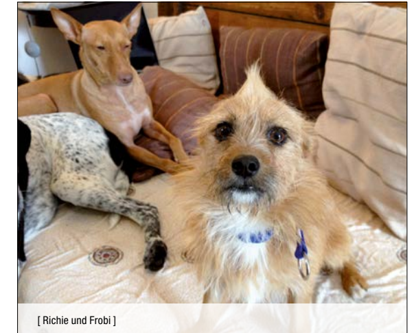
[ Richie und Frobi ]

Ob Hund, Katze, Nager, Vogel oder andere, wir haben oft heimatlose Tiere, die ein neues, liebevolles zu Hause suchen. Welche das sind, seht ihr immer aktuell auf unserer Homepage.