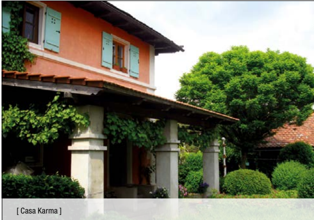
[ Casa Karma ]

Idyllisch inmitten von Wiesen, Wald und Feldern gelegen und von über 11.000 qm Land umgeben, befindet sich unser Gnadenhof.