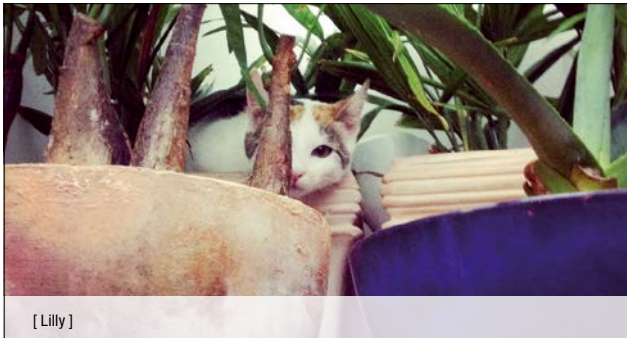
[ Lilly ]

Neben den vermittelbaren Tieren, die nur kurze Zeit bei uns sind, ist unser Gnadenhof auch ein zu Hause für jene Tiere, die alt, gehandicapt, krank oder mehrmals von Hand zu Hand gewandert sind. Bei uns können sie ihren Lebensabend in artgerechter Haltung verbringen.