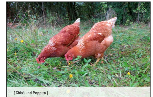
[ Chloé und Peppita ]

Dann ruft uns an oder schreibt uns! Wir bemühen uns, gemeinsam mit euch, für jede Situation eine schnelle und gute Lösung zu finden!